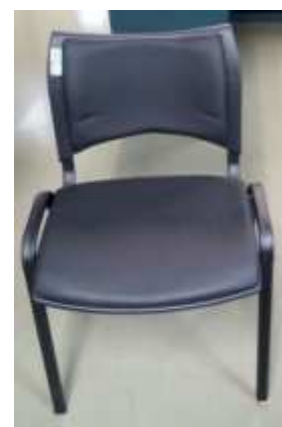
Silla Polipiel Negra

Asimismo está incluido el rotulo del frontis, con un máximo de 25 caracteres.